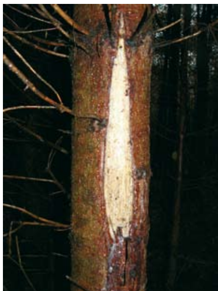
Schälwunden an Fichte