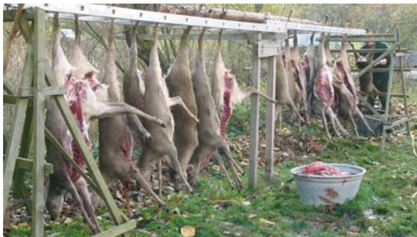
Nachhaltig hohe Schalenwildstrecken sind die Folge hoher Schalenwilddichten.

Die Bundesrepublik zählt damit heute zu den europäischen Ländern mit einer besonders hohen Schalenwilddichte.