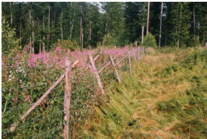
Zaungrenzen zeigen oft am deutlichsten den entscheidenden Einfluss des Rehwildverbisses auf die Entwicklung der Waldverjüngung.

Mit dem Modell wird jedoch auch klar, dass mit der Regiejagd kein Geld zu verdienen, sondern nur Geld zu sparen ist.