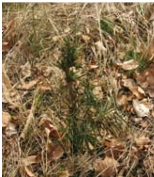
Die Tanne ist besonders verbissgefährdet. Bei hohen Schalenwildsdichten verschwindet sie oftmals vollständig.

Leittriebverbisse über 20%, bei der Tanne über 15% bedeuten, dass die Verjüngung der jeweiligen Baumart erheblich beeinträchtigt ist.