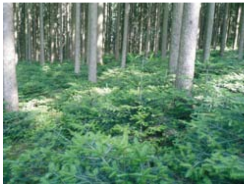
In gut bejagten Revieren kommen auch verbissgefährdete Baumarten wie Tanne oder Eiche großflächig ohne Schutzmaßnahmen (im Bild wesentlich Tanne).